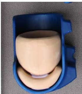
Die Polsterung gehört nicht zum Lieferumfang.

Die abgeschnittene Seite muß immer nach vornezeigen.